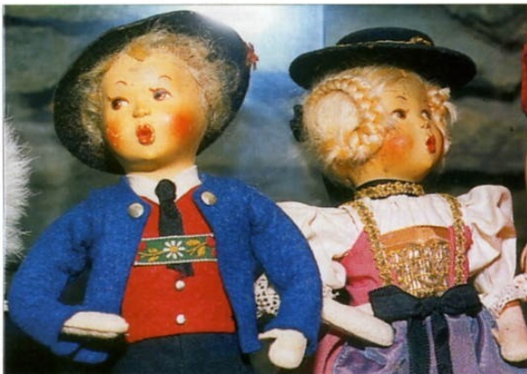
↑ Couple de poupées folkloriques à tête en composition et corps en feutrine bourrée, vêtu d'habits traditionnels autrichiens. H. 30 cm.