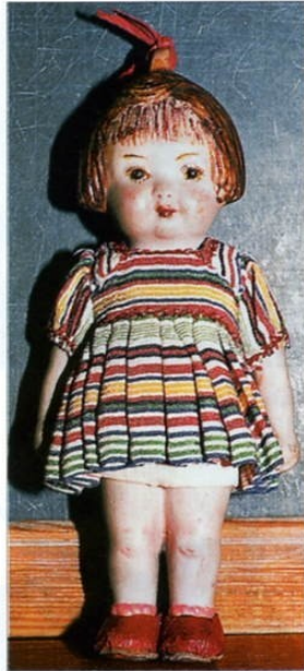
↑ Petite poupée anglaise "Lulu" créée par Hamley Bros en 1916. H. 15 cm.

Plus tard, elle chine les poupées et ours anciens sur les marchés aux puces d'Helsinki où elle trouve surtout des ours allemands et des poupées russes,