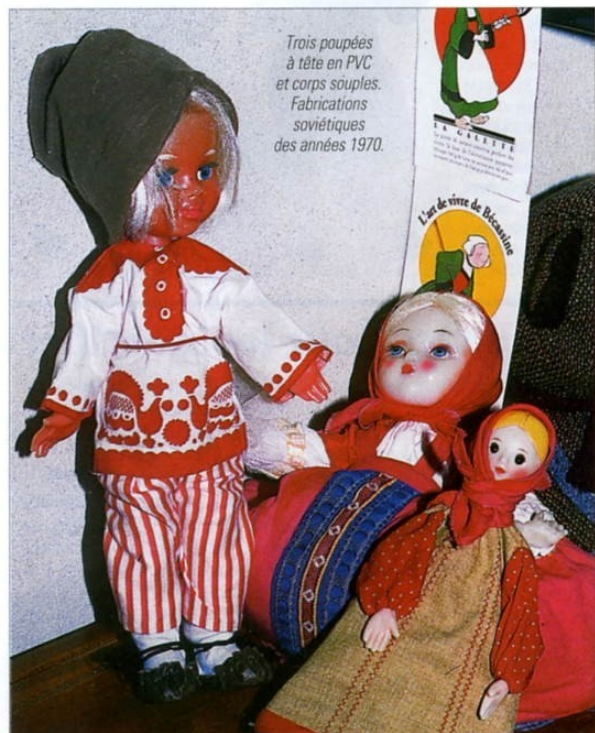
Trois poupées à tête en PVC et corps souples. Fabrications soviétiques des années 1970.