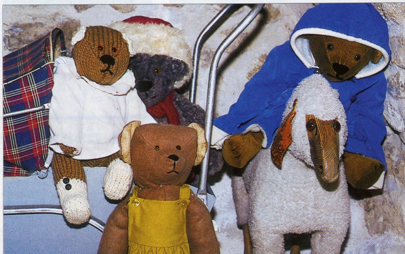
↑ Suli avec chev en bo des années 193