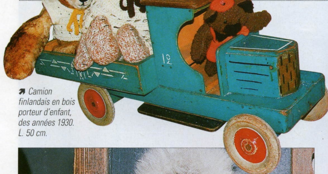
➔ Camion finlandais en bois porteur d'enfant, des années 1930. L. 50 cm.