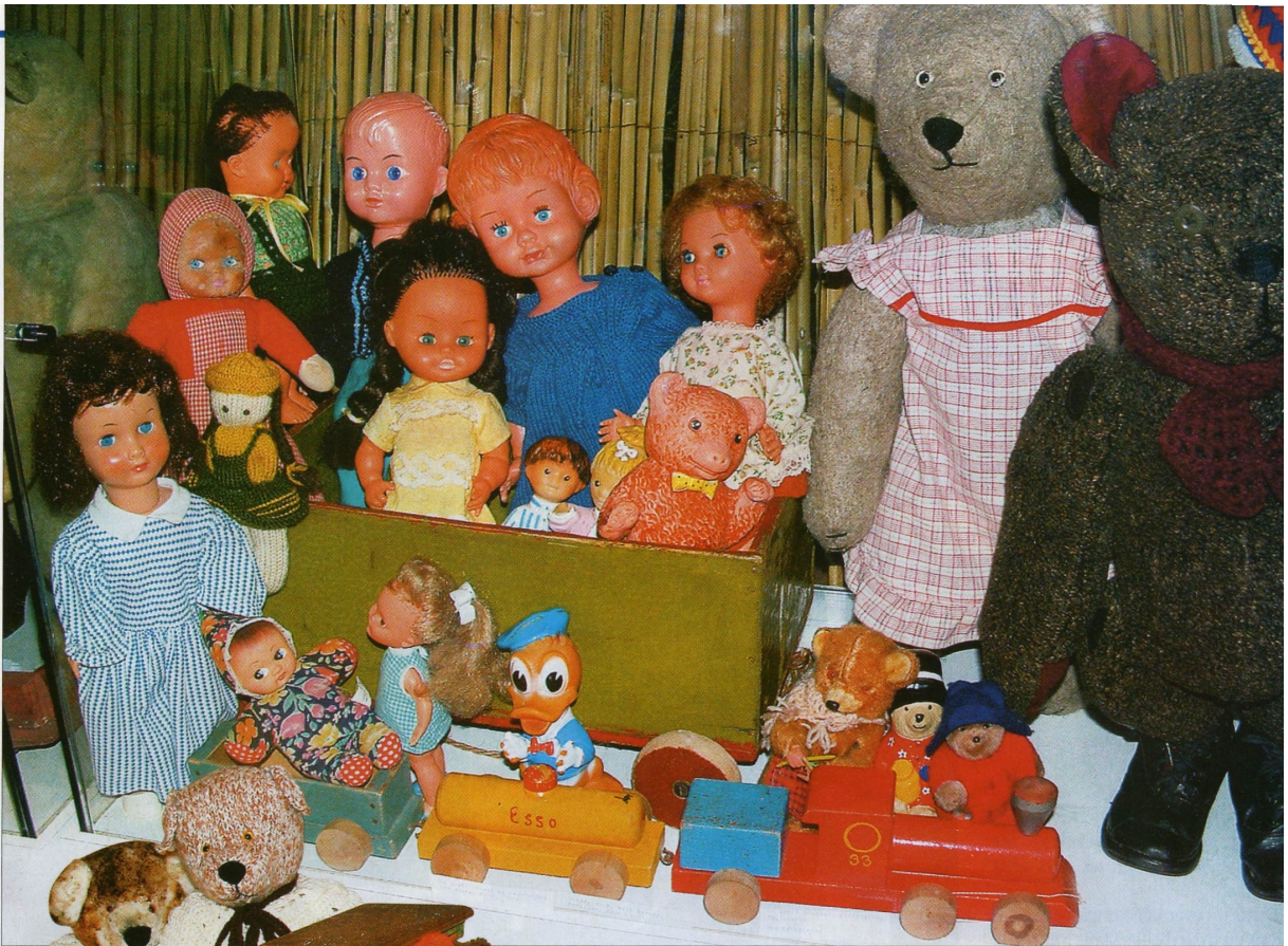
↑ Coffre à jouets, poupées, pouët-pouët et ours des années 1930 à 1970 Au premier plan : un petit train en bois de fabrication finlandaise