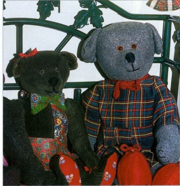
↑ Ours en tissu de velours ou lainage bourrés créés par Ulla-Maija Suonpää, la maîtresse des lieux...

Ainsi forte d'un réseau de collectionneurs et d'artistes qui l'encourage, Ulla-Maija aménage deux salles voûtées de sa maison gardoise