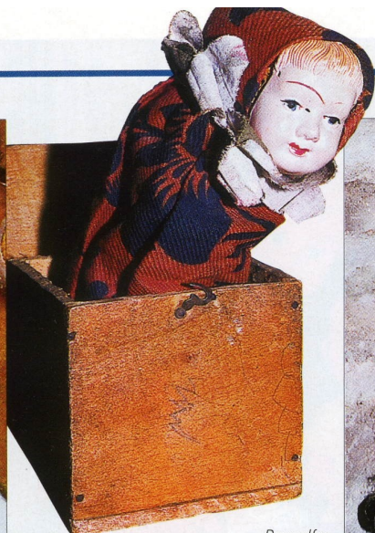
↗ Diable à ressort "Jack in the box" à tête en porcelaine, signé de l'Anglais John Green vers 1900. H. 17 cm.