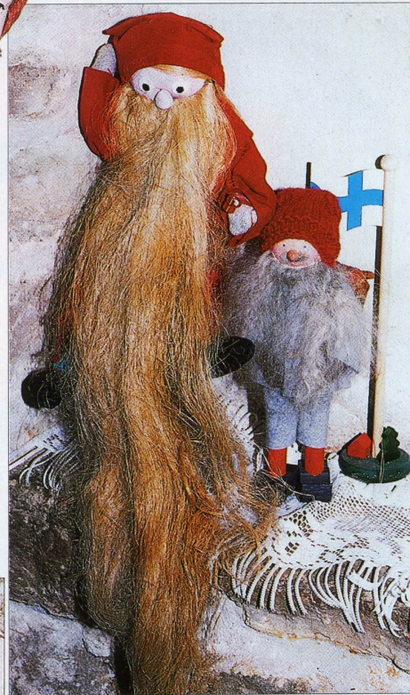
Deux elfes des fables scandinaves en tissu, bois et crin de cheval. Fabrications finlandaises. H. 45 et 35 cm. →

pour exposer ses trésors et recevoir, suivant ses propres termes, "les amis des poupées et des ours sans frontières".