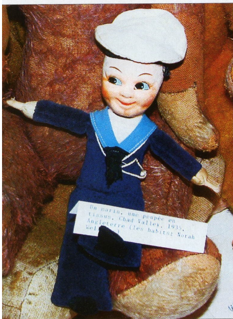
↑ Marin en feutrine bourrée signé par l'Anglais Chad Valley.