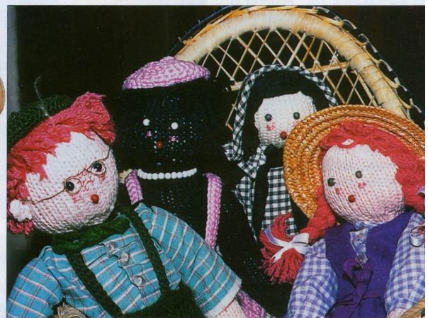
← Poupée finlandaise à tête en composition, corps en tissu bourré des années 1930.